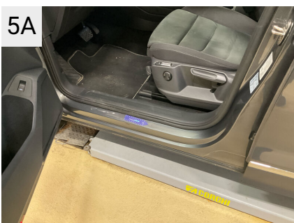
5A Sted V. panel Del Indstigning Venstre For Type Bule(r)