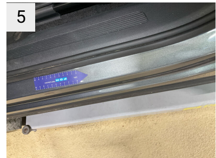
5 Sted V. panel Del Indstigning Venstre For Type Bule(r)