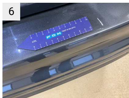
6 Sted Bagkofanger Del Type Ridser