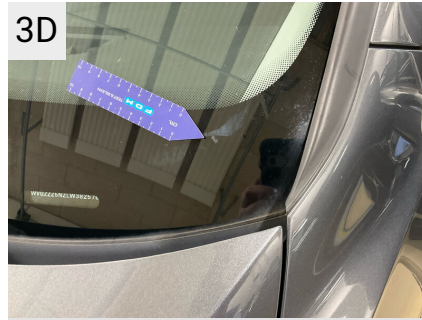
3D Sted Forrude Del Type Stenslag