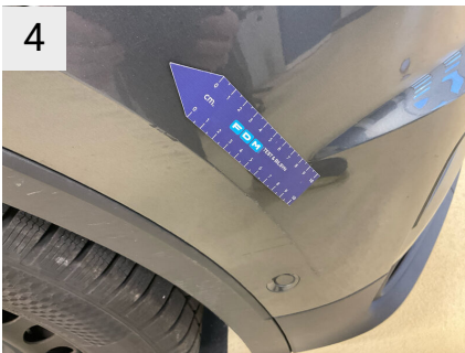
4 Sted Front Del Forkofanger Type Ridser