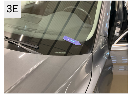
3E Sted Forrude Del Type Stenslag