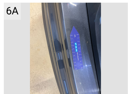
6A Sted Bagkofanger Del Type Ridser