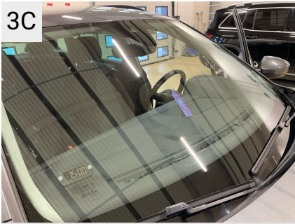
3C Sted Forrude Del Type Stenslag