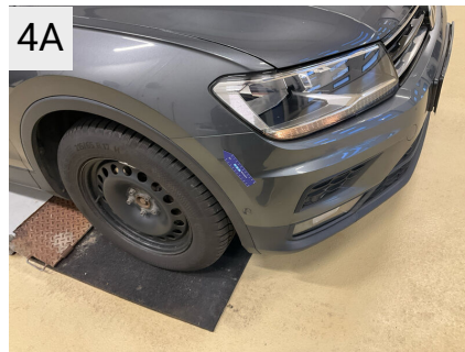
4A Sted Front Del Forkofanger Type Ridser