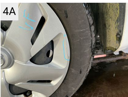
4A Sted Fælge Del Hjulkapsel Type Hak