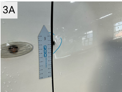
3A Sted V. fordør Del Dørkant Type Bule(r)