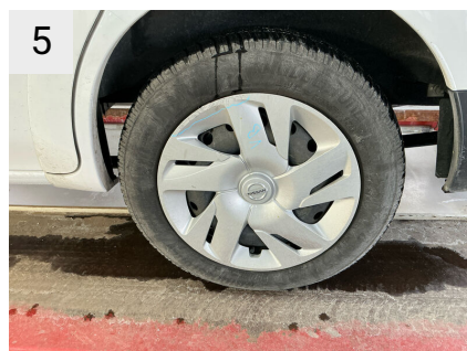
5 Sted Fælge Del Hjulkapsel Type Ridset