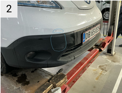
2 Sted Front Del Forkofanger Type Ridser