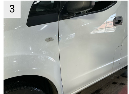
3 Sted V. fordør Del Dørkant Type Bule(r)