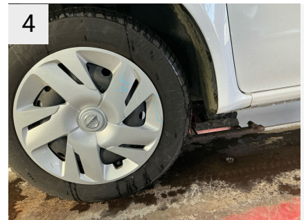
4 Sted Fælge Del Hjulkapsel Type Hak