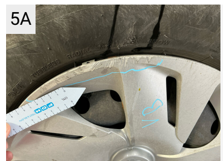
5A Sted Fælge Del Hjulkapsel Type Ridset