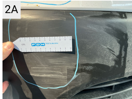
2A Sted Front Del Forkofanger Type Ridser