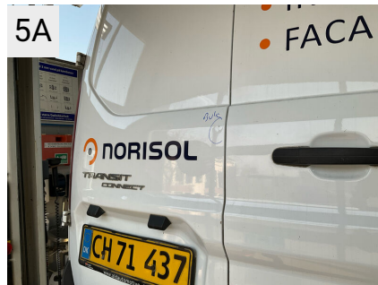
5A Sted Bagklap Del Bagklap Type Bule(r)