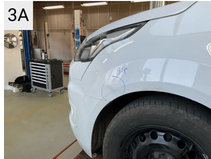
3A Sted V. forskærm Del Skærm Type Bule(r)