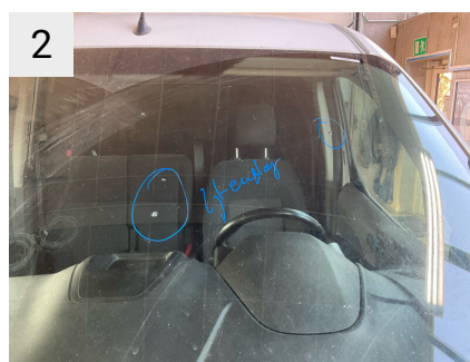
2 Sted Forrude Del Rude Type Stenslag