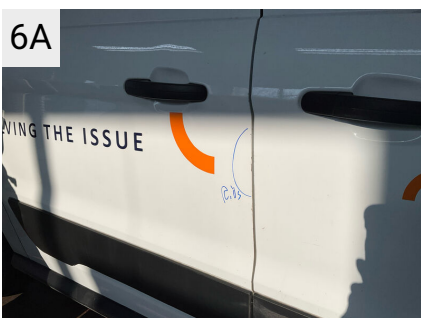
6A Sted H. bagdør Del Dør Type Ridser