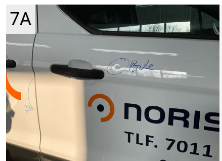
7A Sted H. fordør Del Dør Type Bule(r)