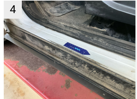
4 Sted V. panel Del Indstigning Venstre For Type Rids