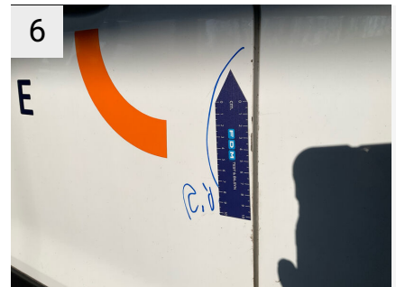
6 Sted H. bagdør Del Dør Type Ridser