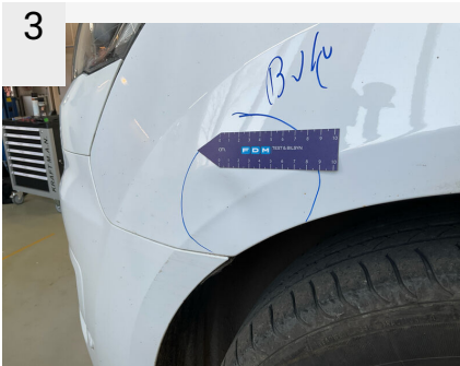
3 Sted V. forskærm Del Skærm Type Bule(r)