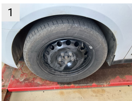
1 Sted Fælge Del Hjulkapsel Type Mangler