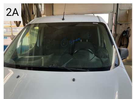
2A Sted Forrude Del Rude Type Stenslag